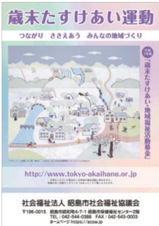
令和7年度 歳末たすけあい運動ポスター

令和6年度の昭島市の募金総額は 2,276,577円 でした。 今年も皆様のご協力をお願いいたします!!