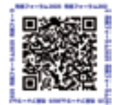
オンラインはこちら