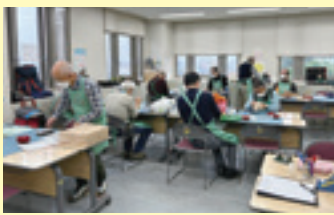
ボランティア活動支援