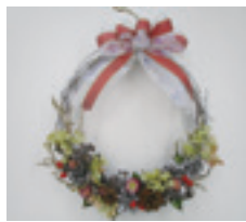
クリスマスリース