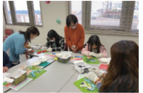
(写真は以前のこどもまつりの様子です。)