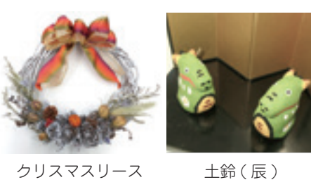
クリスマスリース 土鈴(辰)

あきしま福祉作業所では来年の千支(辰)の土鈴と、都の天然記念物に指定されている「拜島のフジ」を使用した手作りリースを今年も販売しています。 ・土鈴一個 440円 ・リース一個 500円