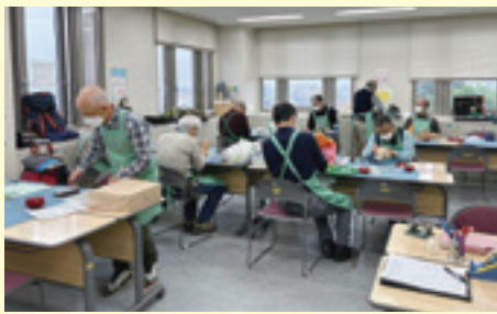
ボランティア活動支援