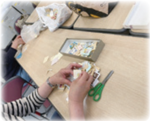
切手整理部活動風景