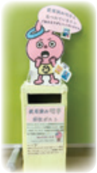
使用済み切手回収ポスト（昭島社協前）