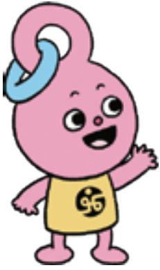
昭島市社会福祉協議会 マスコットキャラクター 「ワーオくん」

ファミリー・サポート・センター(ファミサポ)は、地域において子育ての援助を受けたい人(利用会員)と、子育て支援を行える人(協力会員)が会員となり、地域で助け合う「子育て支援ネットワーク」です。お子さんの保育園や学童の送迎・健診の付き添い・一時預かりなどに協力していただける方を募集します。特別な資格は必要ありません。入会を希望される方は説明会に参加し、事業の趣旨や活動内容を正しく理解した上で入会手続きを行ってください。