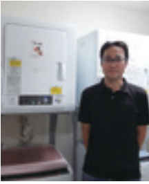
令和元年度に助成金を活用し、乾燥機を購入食工房 ゆいのもり