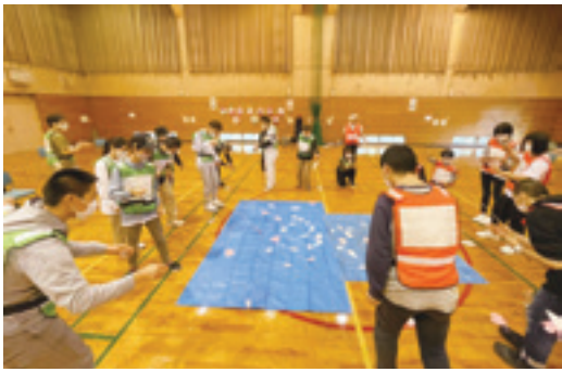
昨年の交流会の様子（魚釣りゲーム）