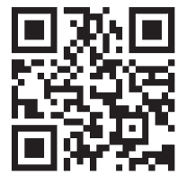
▲専用サイトが開設されました。事業概要はこちらをご覧ください。