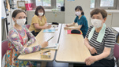
外国人支援団体活動風景