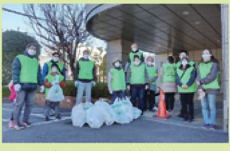
ボランティア活動支援