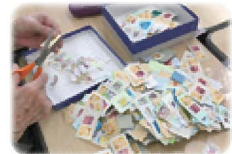
切手整理部活動風景

皆様からご寄付いただいた使用済み切手は、ボランティアグループ「切手整理部」の皆様が国内・海外切手を区別し整理していただき、使用済み切手を収集している個人の方に換金していただいています。収益金は、昭島社協の貴重な活動資金として、福祉事業に活用させていただきます。