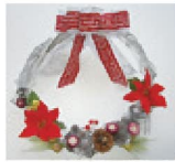
クリスマスリース