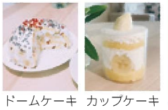
ドームケーキ カップケーキ

ひとり親世帯交流会事業 「親子でかんたん！クリスマスケーキ作り」 親子で楽しめるケーキ作り教室をオンラインで開催します。お子さんの料理経験によって、2つのコースから選べるので「うちの子にはまだ料理は難しいかな」という方も安心してご参加ください。参加された方にはすてきなプレゼントもあります。 ▽開催方法 オンライン（zoom） ①10時30分～11時30分 ②13時～14時30分 ▽対象 市内在住でひとり親の世帯 ▽定員 各10組 ▽申込受付 11月15日（火）9時～11月29日（火）9時～11月29日（火）※詳細、申込みにつきましてはQRコードまたはURLから昭島社協ホームページへアクセスしご確認ください。 URL https://acsw.jp/event/r04hitoriyakoujikai/ ▽協力団体等 おもちゃ病院、バックアップ隊、プラザ5 ▽問合せ 昭島社協 ひとり親世帯交流会事業 担当