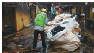
白川郷火災現場 写真

近年多くの自然災害が発生しています。いつ昭島が被災するか、自分がふり掛かるかわかりません。いつ発生してもおかしくない今、災害ボランティアについて話し合いをしませんか？