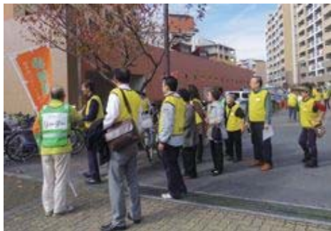
徘徊模擬訓練の様子