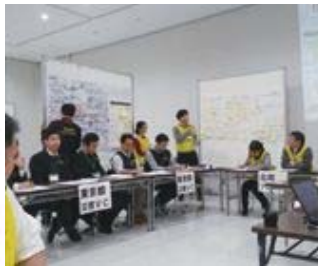
大規模な災害を想定した 災害ボランティアセンター立上げ訓練

昭島市社会福祉協議会（社協）は、住民の皆さんが参加し、共に力を合わせて、地域の活動を推進していく団体です。会員とは、事業に賛同し、財政面から支えていただく社協のサポーターです。地域のために何かしたい、「活動する時間はあまりないけど、力になりたい」という皆さまのあたたかいお心をお寄せください。会費を納めていただくことが会員としての活動であり、大切な財源となります。会員会費は、暮らしと介護、ボランティアやサロン活動、「こどもまつり」などの福祉のまちづくりに活用させていただきます。