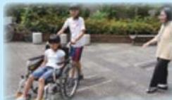
こどもまつり(車いす体験)