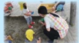
夏の体験ボランティア