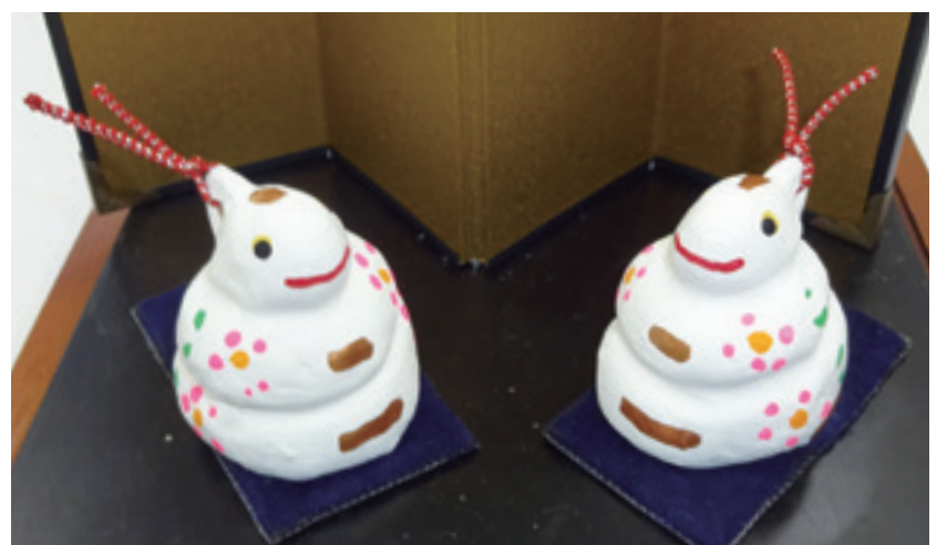
あきしま福祉作業所の十二支土鈴(巳)