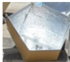
段ボールソーラークッカー

★身近な材料でいざという時に役立つ段ボールソーラークッカー作りワークショップ 段ボールソーラークッカーとは、電気がガスが不要な材料で作るエコな調理器具です。ワークショップに参加したい方は電話でお申し込みください。 ▽定員 10組 申込順 ▽申込み 昭島社協ボラセン ▽材料費 1,500円 ▽時間 13時30分(所要時間は30分～1時間30分)