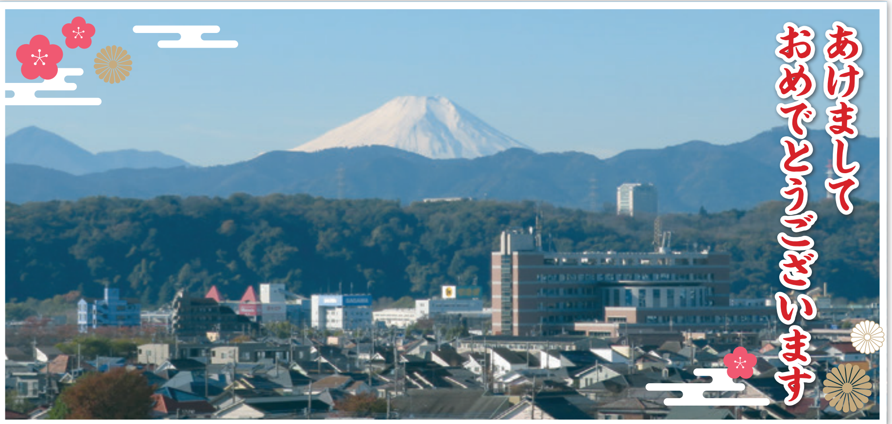
▲昭島市保健福祉センター(あいぼっく)屋上から撮影

昭島市社会福祉協議会(昭島社協)は市民の参加と協力によって運営されている、福祉を進める民間の団体です。